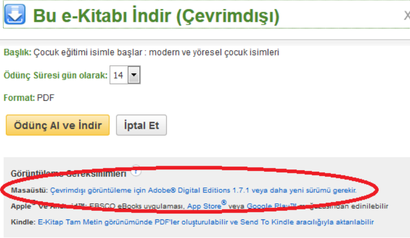
Şekil 9 Adobe giriş sayfası

Kitabınızı sistem dışı görüntülemek için Adobe Digital Editions 1.7.1 veya yeni sürümü gerekmektedir. Yükleme için sekmeyi tıklayıp bilgisayarınıza indirebilirsiniz. (Şekil 9)